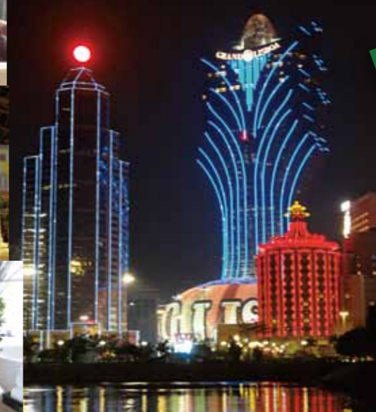
日本と時差が1時間。直行便で4~5時間ととても便利で魅力溢れる観光地です。香港&マカオというプランの時代からマカオ単独に、日本から約40万人が訪れ、人気の「マカオで3泊・4泊」という旅行スタイルに変化しています。

「贅沢な」という言葉は人それぞれイメージが違うと思いますが、今のマカオはすべての人に「ゆとり」とした自在なひとときを「贅沢に」感じさせてくれます。「リッチ」「ラグジュアリー」という単純ではない「満足感」「夢」のような、それでいて刺激的な「魔法の国」。5年ほど前にマカオを旅行した時とは違う、充実度、進化する新しいイメージと多彩な「ステイネーション」「カジノ」「世界遺産の街」「5つ星ラックスホテル」「エンターテイメントなショー」。「東西の食文化が融合した味覚の世界遺産とも言える美食グルメ」「右肩上がりの経済と世界有数のブランドショップ街」「二人歩きできる安心で安全な街」。マカオも最高！すっかり陶酔してしまつた3泊4日をご紹介いたします。富士山静岡空港から定期便はまだですが、チャーター便が予定されているようです。是非、ご参考にしていただければと思います。