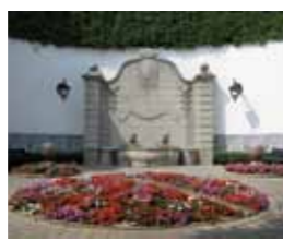
ポルトガル風建築の民政総署はアズレージョで彩られ静かな中庭が広がる。