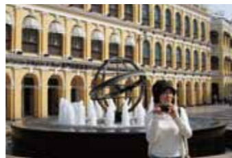
セナド広場はフォトスポット。噴水には大航海時代のシンボル地球儀が。世界遺産観光の起点にも。