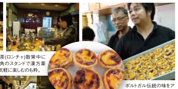
ポルトガル伝統の味をアレンジしたマカオのエッグタルトは欠かせない。