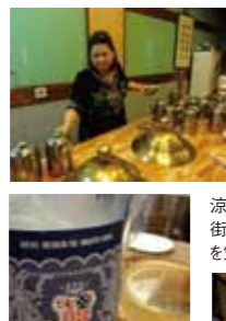
ポルトガル本国でも手に入りにくい「ポルトガルワイン」が並んでいることも。価格もリーズナブル。