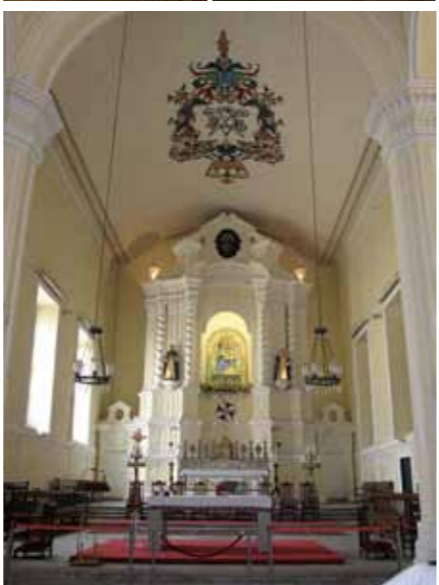
教会群をめぐり心穏やかな時間を。聖ヨセフ修道院聖堂・聖オーガスティン教会など