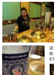
涼茶(ロンチャ)散策中に街角のスタンドで漢方薬を気軽に楽しむのも粋。