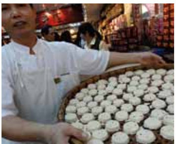
アーモンドクッキーは人気お土産におススメ。