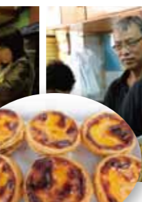
ポルトガル伝統の味をアレンジしたマカオのエッグタルトは欠かせない。