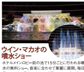
ホテルメインロビー前の池で15分ごとに行われる噴水の無料ショー。音楽に合わせて華麗に展開。毎日昼の11時~深夜0時まで、時間によってプログラムは違う。

シティ・オブ・ドリームズ内の専用シアターで30分ごとに上映されるショー。3D映像、中国の象徴「龍」が繰り広げる縁起の良いストーリー。「龍」が天に昇り、金貨が降り注がれると思わず会場中の人が両手で金貨を掴もうとして顔がほころんでしまう。